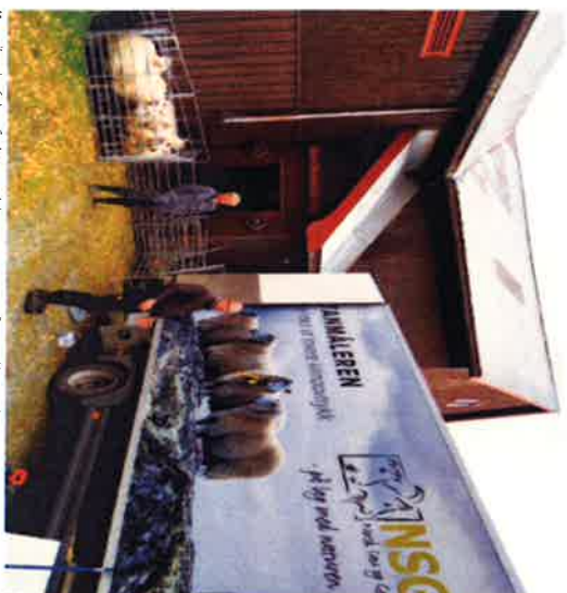
Medlemmer hos Sjøtjern Gjøme, Jostedal og Lura fjellområde er klare på å legge ned metanmålingen.